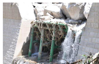
写真-2 鋼製透過型堰堤の事例 1