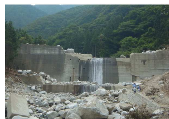
写真-4 コンクリート堰堤の事例