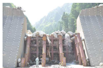
写真-3 鋼製透過型堰堤の事例 2