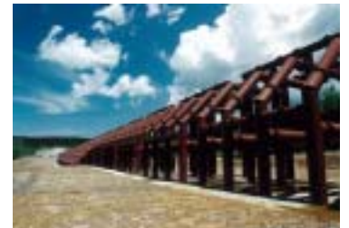
写-3 土石流捕捉工の設置例（十勝岳）

箱形部材は安全な場所で組み立て、ヘリコプターで輸送・設置すれば、短期間かつ安全な工事が可能である。鋼材については調達に時間を要するので、市中材料が使用できる構造とする。