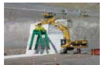
写-1 無人化施工の例(雲仙・普賢岳)