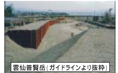
写-2 導流堤の設置例

施工期間は数週間から2ヶ月程度であるが、鋼材の調達には時間を要し、現地搬入までに2ヶ月～4ヶ月程度が必要となる。