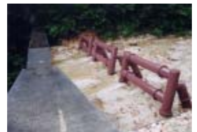
写-4 鋼管基礎の設置