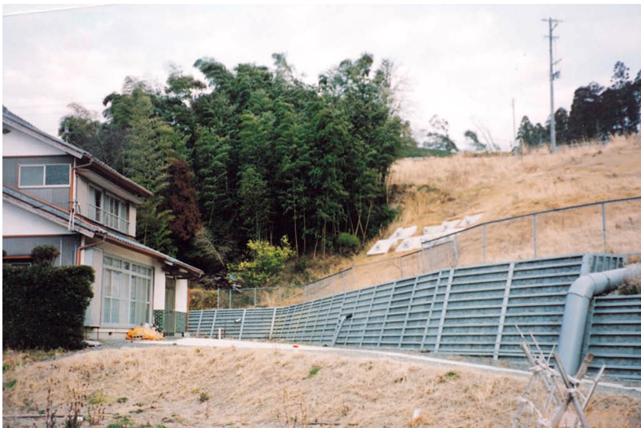
小笠郡菊川町 壁高3m 平成12年[静岡県]