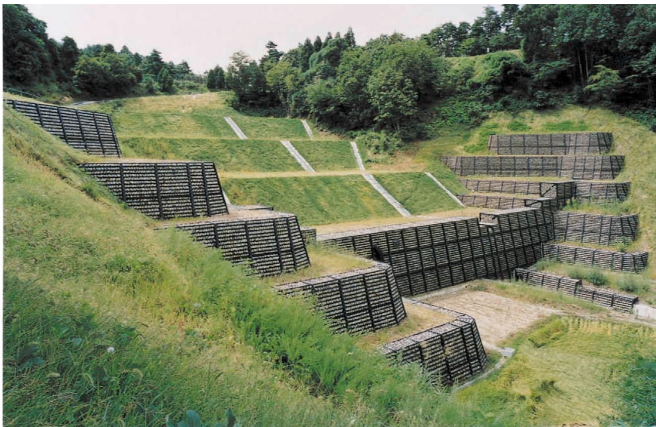
魚津室田地内 稗島富川(ヒエバタケトミカワ)地区災害関連緊急地すべり対策 壁高9m 平成8年[富山県]