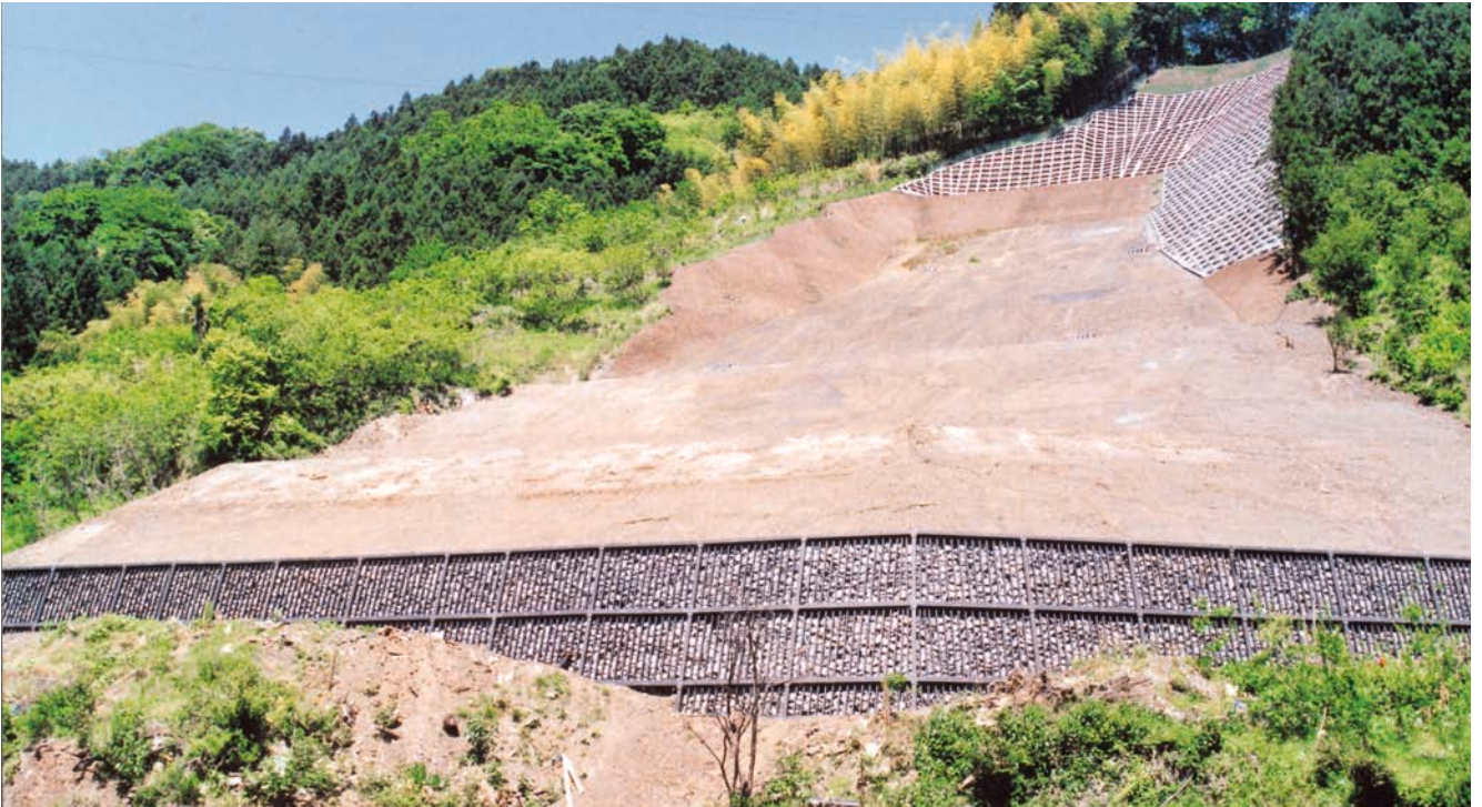
堤高6m 平成5年度[埼玉県]

両神村塩沢地先で発生した地すべり災害の対策事業で、押さえ盛土工を実施し、その盛土の土留工として鋼製続枠を設置。